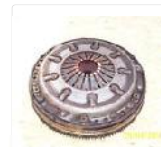
VW Passat 3B / 1.6 / AHL /...