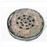
ZWEIMASSEN SCHWUNGRAD LUK... EUR 99,00