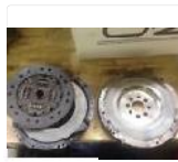
BMW E30 E34 E36 Schwungrad Kupplu...