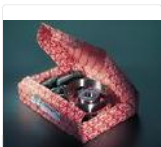
ELRING Reparatursatz, Schwungrad