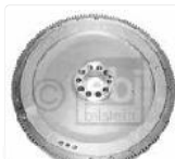
FEBI BILSTEIN Schwungrad