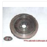
Schwungrad MERCEDES-BENZ 1... EUR 40,00