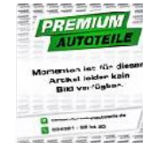
SACHS Original 2294 001 107... EUR 436,39