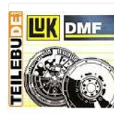
LuK ZMS ZweimassenschwDMF EUR 499,00