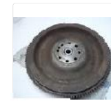
Peugeot J5 280 2,5TD U25/673...