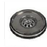
SACHS Original 2294 001 744... EUR 378,89