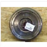
392377 [Schwungrad] MERCEDES-BENZ... EUR 49,00