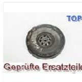
ZWEIMASSENSCH... EUR 195,00